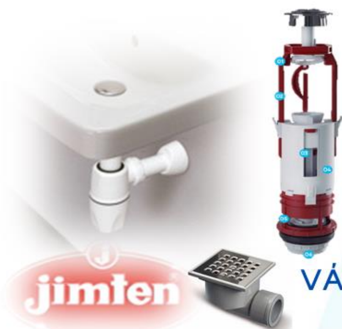
TABELA N° 21